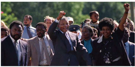
Après 27 ans de prison, Nelson Mandela est libéré sur décision du gouvernement blanc.