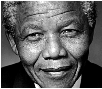
Nelson Mandela ( 1918-2013 ) Président de l'Afrique du Sud (1994-1999) et prix Nobel de la Paix en 1993

Né en 1918 à Mvezo ( Province du Cap ) Nelson Mandela s'engage très jeune dans le combat contre l'Apartheid en Afrique du Sud. Avocat, il devient membre du Congrès National Africain (ANC) qui lutte pour l'accès des Noirs au droit de vote, selon le slogan « une personne, une voix ». A la suite d'actions violentes contre le gouvernement blanc, il est condamné en 1964 à la prison à vie. Libéré en 1990, élu président de la République d'Afrique du Sud en 1994 il instaure la démocratie et œuvre pour la réconciliation des Sud-Africains.